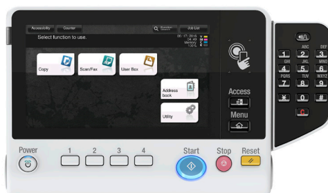
Innovativo pannello multi-touch da 7" con area di autenticazione NFC e tastiera opzionale (KP-101)