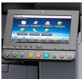
Pannello tattile a sfioramento da 9" a colori